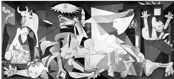
Fig. 1. Guernica (Picasso 1937) 4